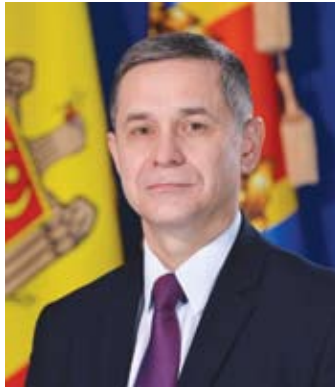
Ministrul Apărării al Republicii Moldova, Anatolie NOSATÎ